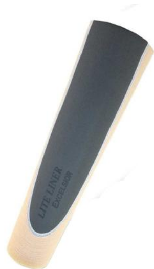
SIN PIN ESTÁNDAR