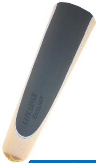
CON PIN ESTÁNDAR